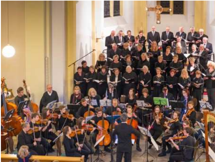
Musiker und Sänger stimmten die Zuhörer in der Heisterbacherrotter Pfarrkirche mit ausgewählten Stücken auf Weihnachten ein.

HEISTERBACHERROTT. Das gemeinsame Weihnachtskonzert des Kammerchors Oberpleis und des Schedrik-Chors des Gymnasiums am Oelberg im Rahmen der Reihe "Forum Musicum Königswinter" ist an sich immer schon ein musikalischer Genuss.